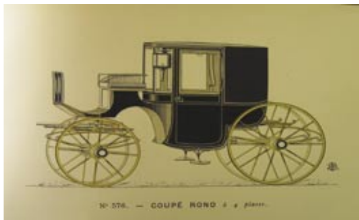
un extrait du catalogue de la firme sancoinnaise Cf. : J. Libourel. Voitures hippomobiles. Éd. du patrimoine. Monum. 2005. (A. D. du Cher BR 1233)

ces projets ; l'usine travaille pour l'aviation durant le conflit. Ensuite malgré des améliorations techniques, elle n'arrivera pas à prendre pied dans les nouveaux marchés du transport ; elle fermera ses portes à l'aube de la seconde guerre mondiale. Les bâtiments ont accueilli ensuite différentes entreprises. Dans les années 1980 un incendie a causé de gros dégâts (usine de plastiques). La commune de Sancoins a acheté cet espace industriel pour ses locaux techniques, parkings et autres projets en cours. Elle a conservé le fronton démonté de l'usine pour l'intégrer dans une nouvelle construction, (près des pavillons jumeaux construits pour les frères Rétif), souvenir d'une activité passée prestigieuse.