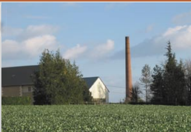
à Saint-Martin des Champs

Avec le risque évident de subir le rythme et le bon vouloir de chacun d'entre eux et ainsi de perdre la maîtrise