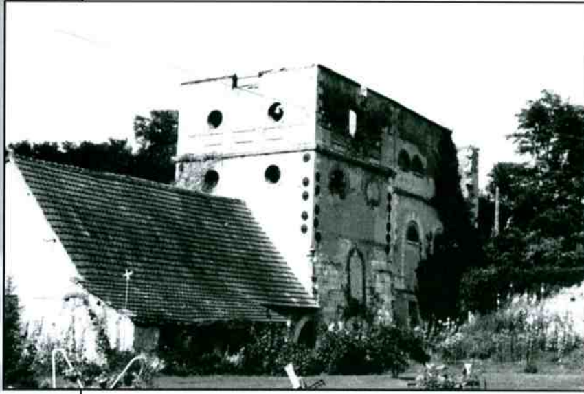
La Guerche-sur-l'Aubois Le Fourneau 1990

■ En Pays de Tronçais (Allier) - à 14, 15 et 16 heures : Forges de St Bonnet-de-Tronçais (accueil) et site de Sologne.